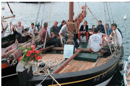
La Ciotat, Acampado, mai 2004

UNE TRENTAINE D'ADHERENTS PEUVENT AINSI NAVIGUER !