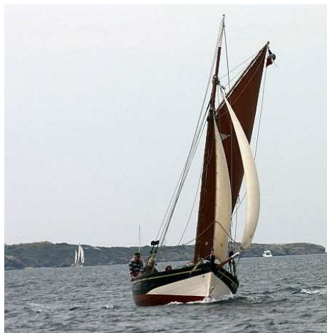
Sanary, Virée de St Nazaire, mai 2008