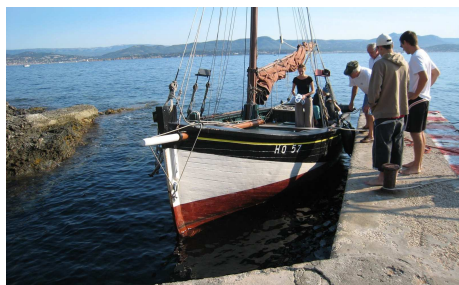
Pique-nique, ile du grand Rouveau, aout 2008