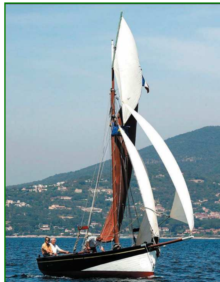
Marthe-Auguste, grande chaloupe crevettière de Honfleur