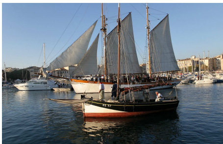
La Ciotat, il était une fois 1720, octobre 2008