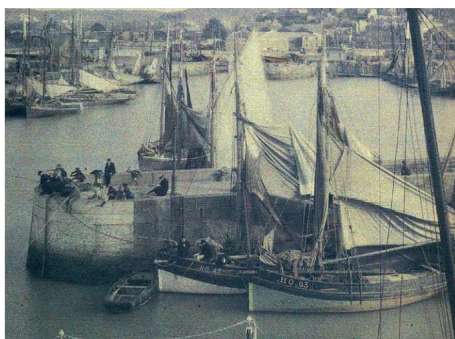
Port de Honfleur : voiles et filets séchant après la marée