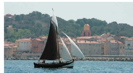
Voiles latines de Saint Tropez, mai 2005

L'association « Les Amis de Marthe-Auguste » gère ses sorties en baie de Sanary.