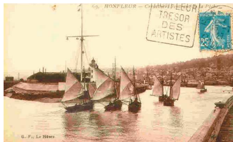
Honfleur : chaloupes rentrant de la pêche

La plupart d'entre elles seront détruites lors du débarquement de Normandie.